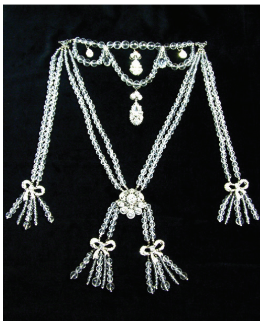
LE COLLIER DE MARIE ANTOINETTE (RECONSTITUTION).

Marie Antoinette est devenue reine en 1774, et puisqu'elle semblait dominer son mari, Louis XVI, on pensait que c'était elle qui gouvernait – et elle régnait mal, se laissant entraîner dans toutes sortes d'affaires douteuses comme, par exemple celle du « collier » qui éclate en 1785.