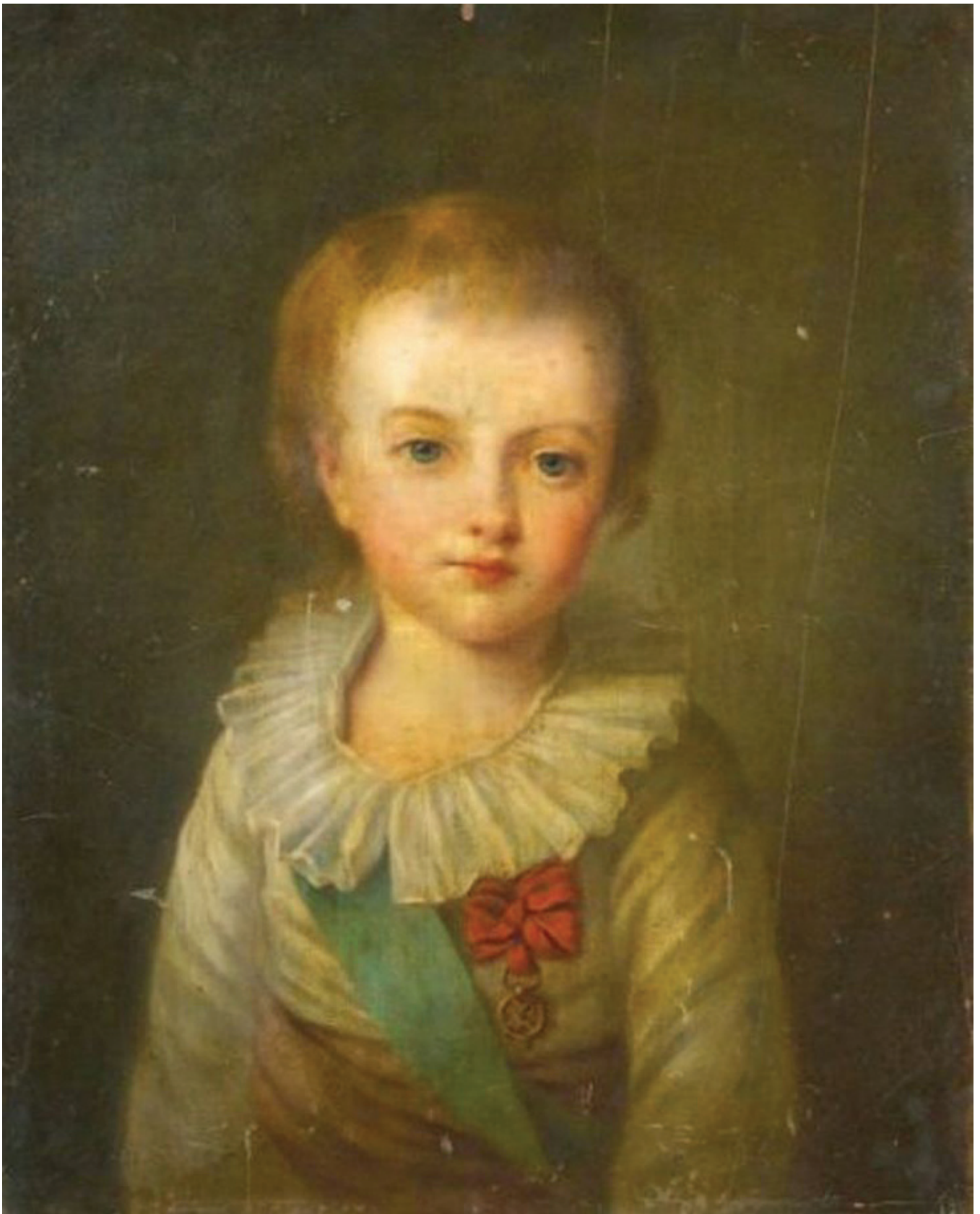
ÉCOLE DE VIGÉE LEBRUN, LOUIS-JOSEPH, FILS AÎNÉ DE MARIE ANTOINETTE , VERS 1789.