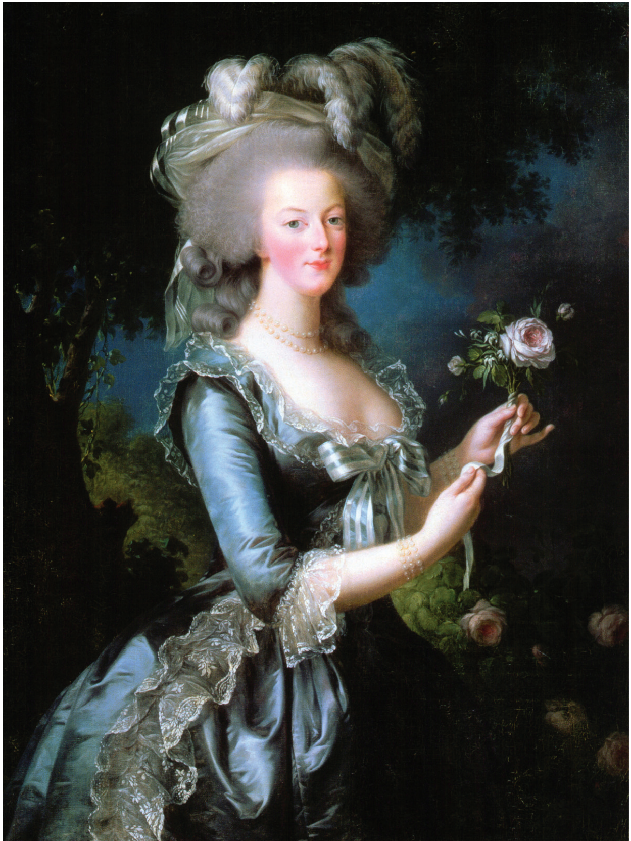
VIGÉE LEBRUN, MARIE ANTOINETTE À LA ROSE , 1783