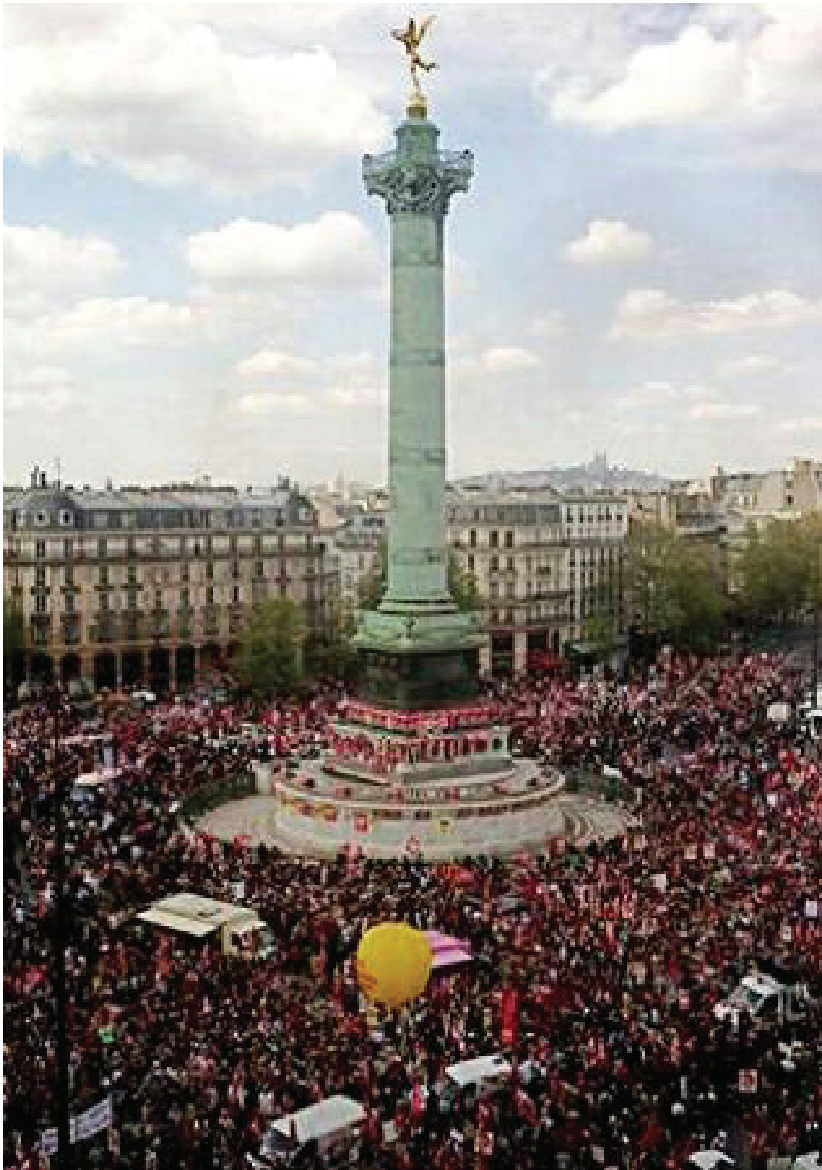
LA PLACE DE LA BASTILLE, 2013.