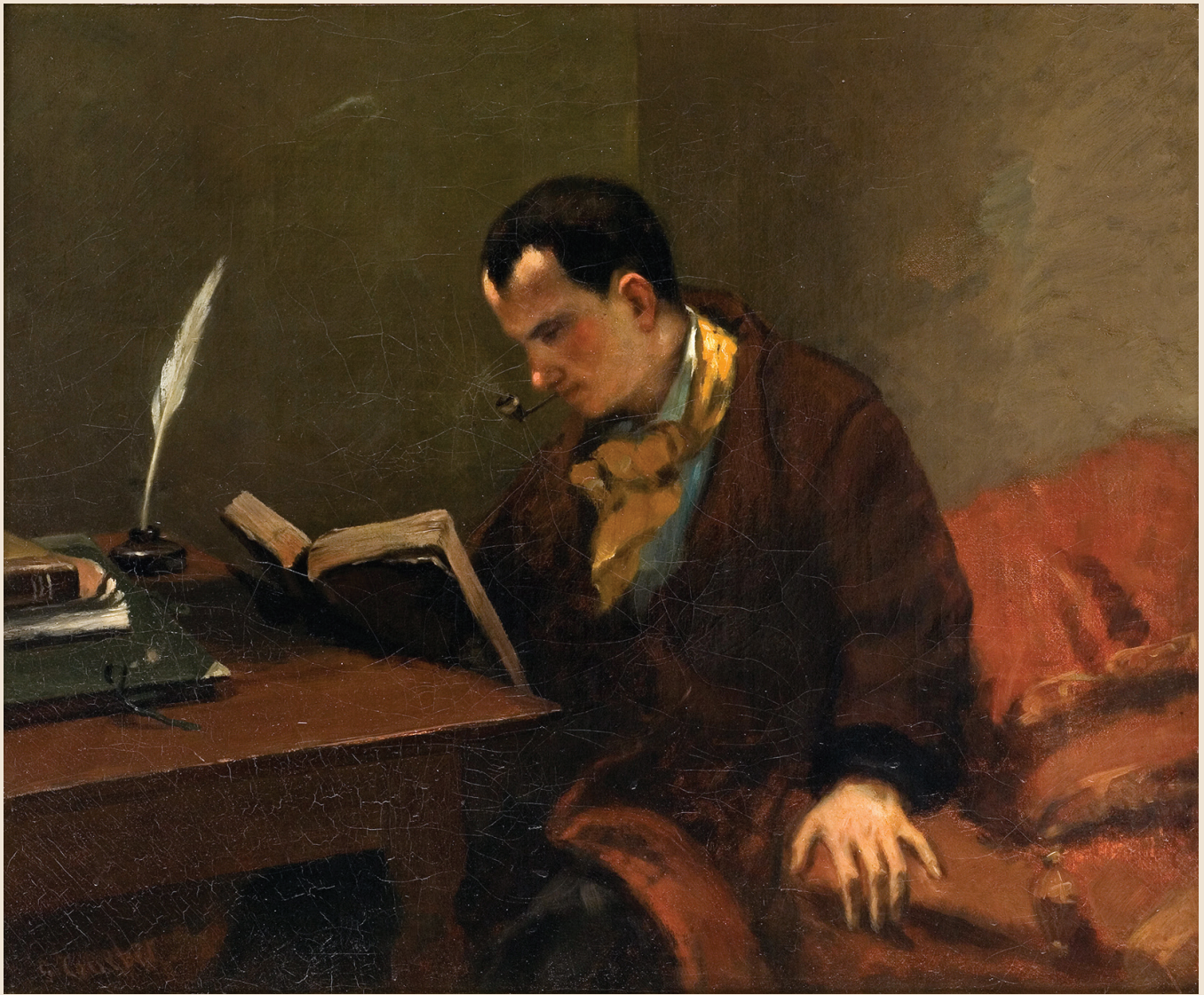
Portrait de Baudelaire, Gustave Courbet, vers 1848.