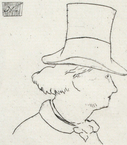
BAUDELAIRE EN PROFIL, MANET, 1862.

On considère Baudelaire comme le père de l'art moderne puisqu'il explorait la possibilité que la beauté n'était pas exclusivement un dérivé de la bonté. C'est-à-dire, Baudelaire a cherché la beauté dans la cruauté, les vices, les paradis artificiels (comme les drogues, par exemple) et dans la laideur même.