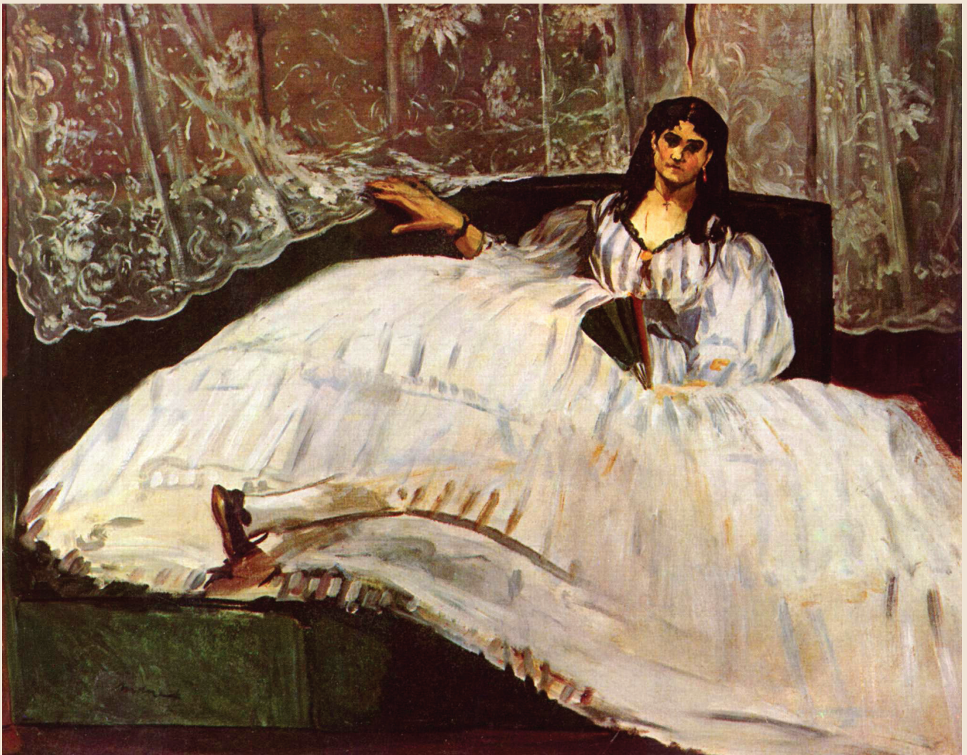
JEANNE DUVAL , EDOUARD MANET, 1862.

C'est vers cette époque que Baudelaire fréquentait la prostituée Sarah La Louchette avant de tomber amoureux de Jeanne Duval, la « jeune mulâtresse » qui a inspiré plusieurs de ses plus beaux poèmes.