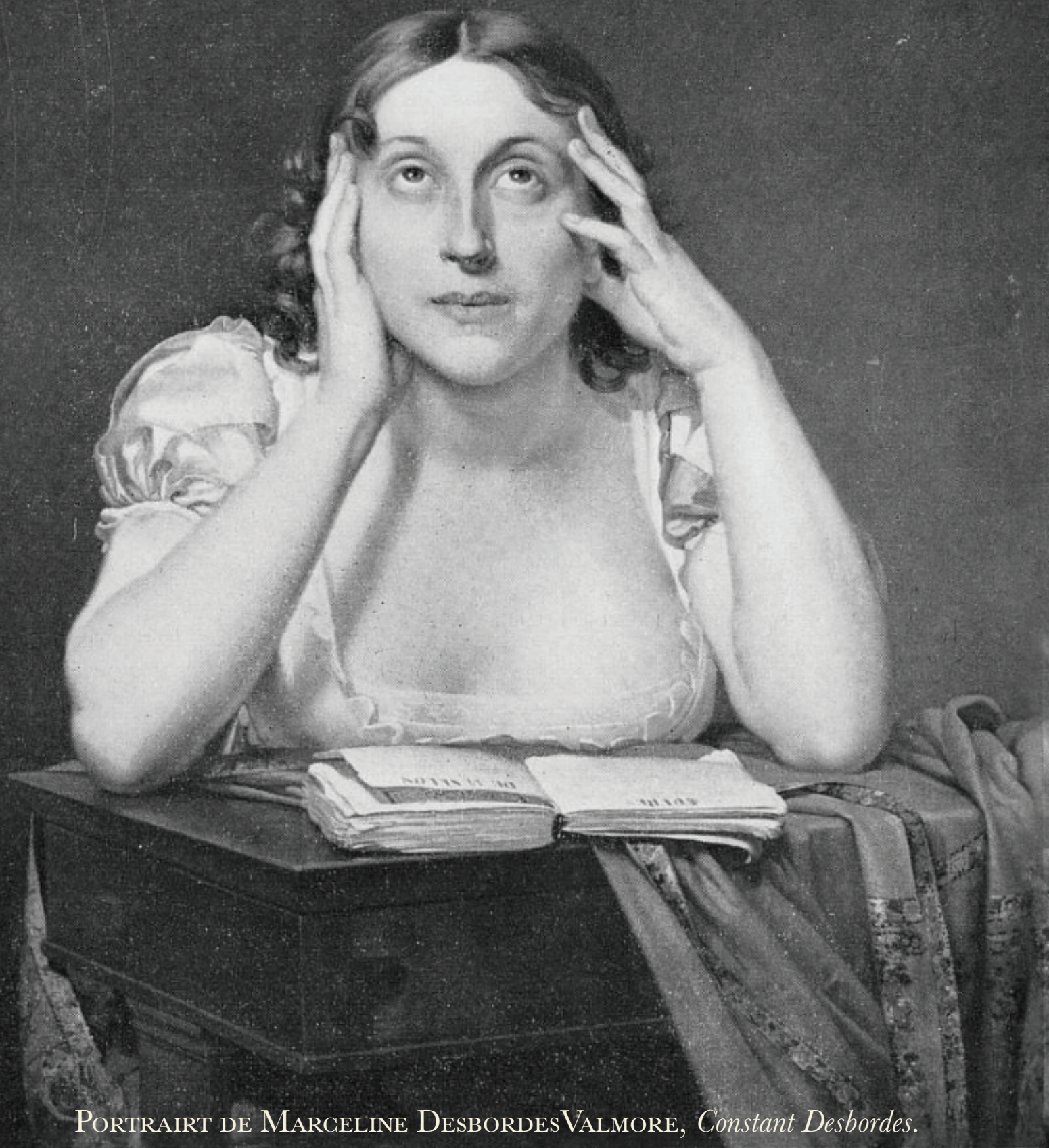
Portrait de Marceline Desbordes-Valmore, Constant Desbordes.